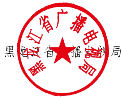
黑龙江省广播电视局