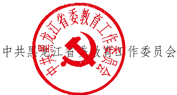
中共黑龙江省委教育工作委员会