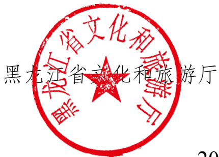
黑龙江省文化和旅游厅