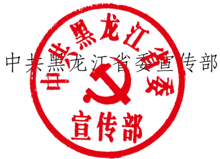
中共黑龙江省委宣传部